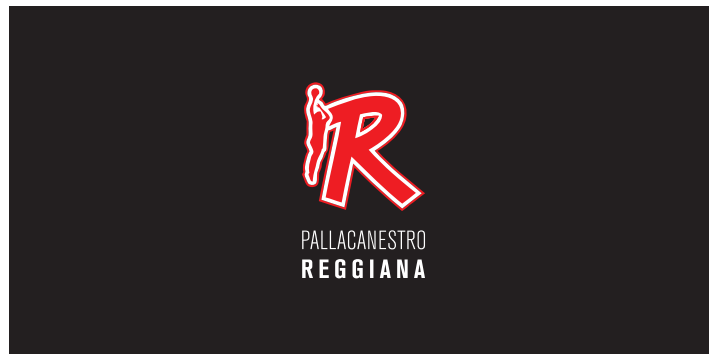
a 1 colore