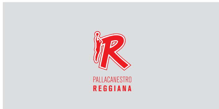
a 1 colore